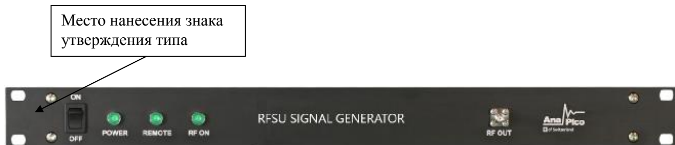
Рисунок 3 – Общий вид лицевой панели модификации генераторов с опцией 1URM и модификации RFSU12-FSK