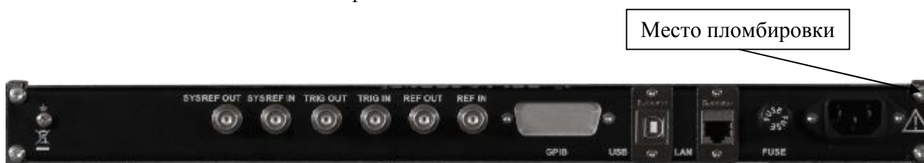
Рисунок 4 – Общий вид задней панели модификации генераторов с опцией 1URM и модификации RFSU12-FSK